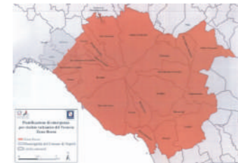
Piano emergenza Vesuvio Zona rossa 1