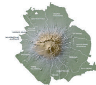
Parco nazionale del Vesuvio Delimitazione territoriale