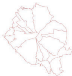
Piano Strategico Operativo Area vesuviana