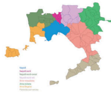
Città metropolitana di Napoli Suddivisione in aree (2010)